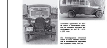
Автобус на базе автомобиля «Вольво» в период довоенного периода, изготовленный на предприятии «Сибирский Автобус», 1933 год.