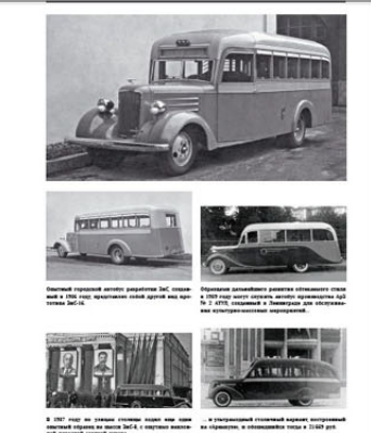
Автобус на базе автомобиля «Вольво» в период довоенного периода, изготовленный на предприятии «Сибирский Автобус», 1933 год.