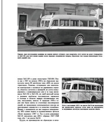
Автобус на базе автомобиля «Вольво» в период довоенного периода, изготовленный на предприятии «Сибирский Автобус», 1933 год.