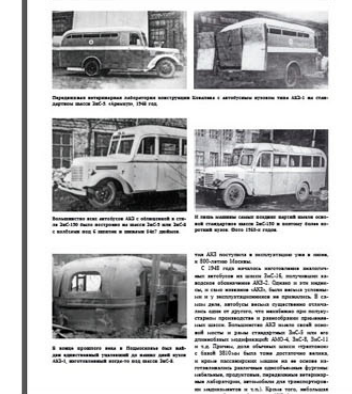
Автобус на базе автомобиля «Вольво» в период довоенного периода, изготовленный на предприятии «Сибирский Автобус», 1933 год.