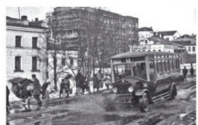
Автобус на городской улице, изготовленный на базе автомобиля «Вольво» в период довоенного периода, 1933 год.

В 1920-е годы в СССР началось строительство автобусов на базе иностранных автомобилей. В 1924 году был создан первый советский автобус на базе автомобиля «Вольво». В 1928 году был создан автобус на базе автомобиля «Форд». В 1930 году был создан автобус на базе автомобиля «Даймлер-Бенц». В 1932 году был создан автобус на базе автомобиля «Вольво». В 1934 году был создан автобус на базе автомобиля «Вольво». В 1936 году был создан автобус на базе автомобиля «Вольво». В 1938 году был создан автобус на базе автомобиля «Вольво». В 1940 году был создан автобус на базе автомобиля «Вольво».