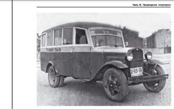
Автобус на базе автомобиля «Вольво» в период довоенного периода, изготовленный на предприятии «Сибирский Автобус», 1933 год.

В 1920-е годы в СССР началось строительство автобусов на базе иностранных автомобилей. В 1924 году был создан первый советский автобус на базе автомобиля «Вольво». В 1928 году был создан автобус на базе автомобиля «Форд». В 1930 году был создан автобус на базе автомобиля «Даймлер-Бенц». В 1932 году был создан автобус на базе автомобиля «Вольво». В 1934 году был создан автобус на базе автомобиля «Вольво». В 1936 году был создан автобус на базе автомобиля «Вольво». В 1938 году был создан автобус на базе автомобиля «Вольво». В 1940 году был создан автобус на базе автомобиля «Вольво».