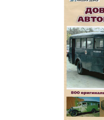
Автобус на базе автомобиля «Вольво» в период довоенного периода, изготовленный на предприятии «Сибирский Автобус», 1933 год.