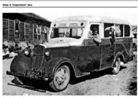
ЗиС-150 — базовый грузовик для первых советских автобусов. Изготовлен в 1942 году на территории эвакуированного завода ЗиС в городе Куйбышев.

В 1942 году на территории эвакуированного завода ЗиС в городе Куйбышев были созданы первые советские автобусы. Они были изготовлены на базе грузовиков ЗиС-150. Эти автобусы использовались для перевозки пассажиров в условиях военного времени. В это время автобусы использовались для перевозки солдат, раненых и эвакуированных граждан. В послевоенный период автобусы стали использоваться для перевозки пассажиров в городах и на междугородних маршрутах.