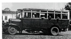
Автобус на базе грузовика ЗиС-150 в условиях довоенной войны, изготовленный на территории эвакуированного завода ЗиС в городе Куйбышев, 1942 год.