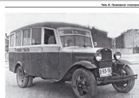
ЗиС-150 — базовый грузовик для первых советских автобусов. Изготовлен в 1942 году на территории эвакуированного завода ЗиС в городе Куйбышев.

В 1942 году на территории эвакуированного завода ЗиС в городе Куйбышев были созданы первые советские автобусы. Они были изготовлены на базе грузовиков ЗиС-150. Эти автобусы использовались для перевозки пассажиров в условиях военного времени. В это время автобусы использовались для перевозки солдат, раненых и эвакуированных граждан. В послевоенный период автобусы стали использоваться для перевозки пассажиров в городах и на междугородних маршрутах.