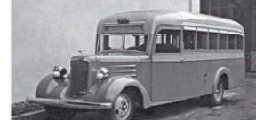
ЗиС-150 — базовый грузовик для первых советских автобусов. Изготовлен в 1942 году на территории эвакуированного завода ЗиС в городе Куйбышев.