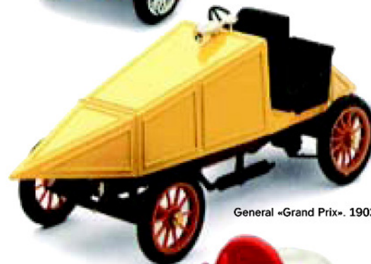
General «Grand Prix». 1902