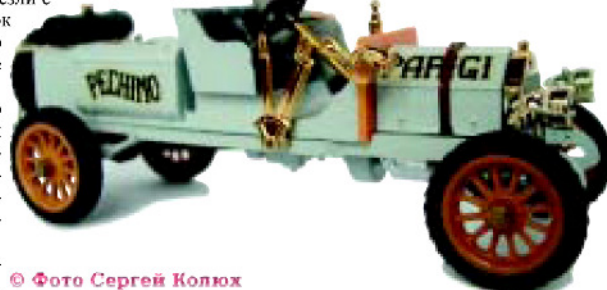
Thomas Flyer. 1908