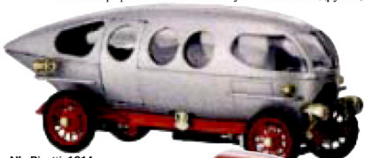
Alfa Ricotti. 1914