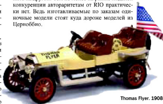
Thomas Flyer. 1908