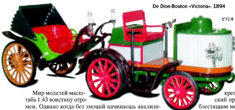
De Dion-Bouton «Victoria». 1894

ется паровой De Dion-Bouton «Victoria» 1894 г., выигравший конкурс «безлошадных экипажей» по трассе Париж-Руан, однако формально лишённый лавров победителя из-за своей конструкции. Дело в том, что этот паровой экипаж был двухсекционным: к двухосному тягачу сзади крепился одноосный пассажирский прицеп с тентом. Цветастая, с блестящим металлическим паровым котлом модель очень интересна и не имеет аналогов.