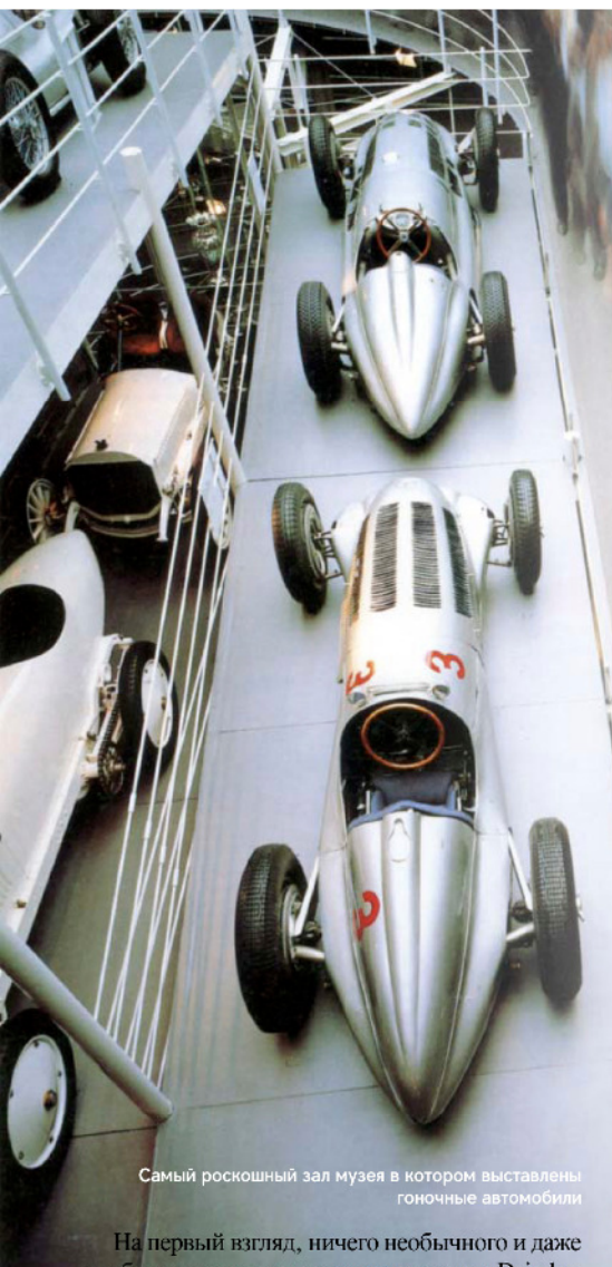
Самый роскошный зал музея в котором выставлены гоночные автомобили

На первый взгляд, ничего необычного и даже особенно интересного в музее компании Daimler-Chrysler нет. Собственно говоря, этот музей большого отношения к автомобилям Chrysler не имеет – это, конечно, музей автомобилей Mercedes-Benz. И вот если взглянуть на это трёхэтажное здание с такой позиции, под таким углом зрения, то интерес возникает сразу! Ведь Готтлиб Даймлер и Карл Бенц никогда не знали друг друга, но почти одновременно в 1886 г. выпустили свои первые автомобили. И, обратите на это особое внимание, получили официальные патенты на данные средства транспорта. Все остальные соискатели пальмы первенства «первых создателей автомобилей» делали одно из двух: либо оформляли документы на самодвижущийся аппарат, либо пытались ездить на каких-то тележках. Иногда тележки даже двигались, особенно с горы. Но Карл и Готтлиб перепатентовали всех, а потому их музей и должен быть особенно интересен. И это на самом деле так, просто не все это хорошо понимают!