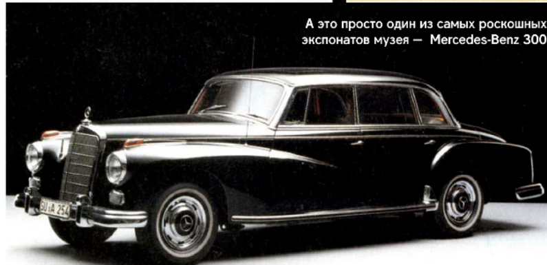
А это просто один из самых роскошных экспонатов музея – Mercedes-Benz 300

Всем известно, что Готтлиб Даймлер в момент создания своего первого автомобиля в 1886 г. был человеком