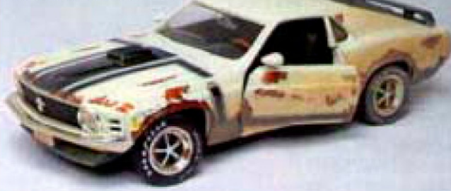
Ржавый «Мустанг» 1965 года

поставить в интерьер мастерской, не правда ли? В этом году «Ertl» выпустила 600 штук вот таких битых и ржавых моделей для определения спроса. Кстати, полностью ознакомиться с серией «Rough and Tumble» можно в Интернете ( www.supercar1.com ).